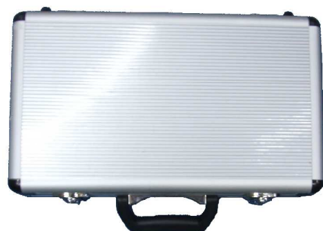
持ち運び時の破損を防ぐアルミケース 400X260X100 ¥4800(税込み)