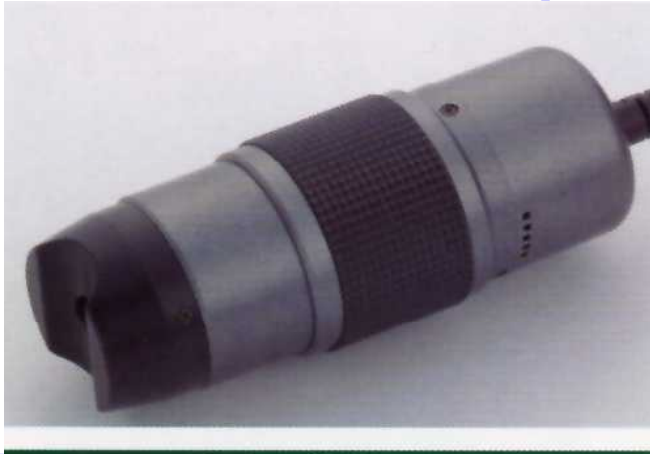
超小型携帯スコープ