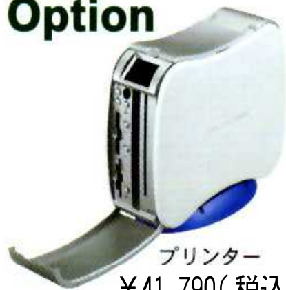
プリンター ¥41.790(税込み)