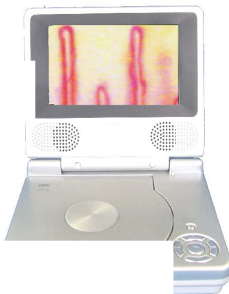
コンパクト型モニター (AV.OUT 端子付、DVD 再生対応) ¥19.800(税込み)