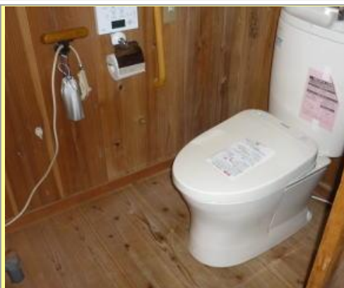
(水洗式 臭いしない 衛生的)

標準設備工事費(便器.手洗い.解体..処分費用は除く) ¥68万~75万(税別) 施工は3日間程度で水洗トイレ トイレ使用禁止(3時間程度) 便器取付.水道配管時のみ