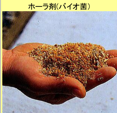
ホーラ剤(バイオ菌)