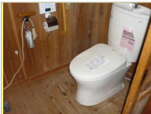
(水洗式 臭いしない 衛生的)

標準設備工事費(便器.手洗い.解体.処分費用は除く) ¥68万~75万(税別) 施工は3日間程度で水洗トイレ トイレ使用禁止(3時間程度) 便器取付.水道配管時のみ