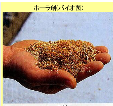
ホーラ剤(バイオ菌)